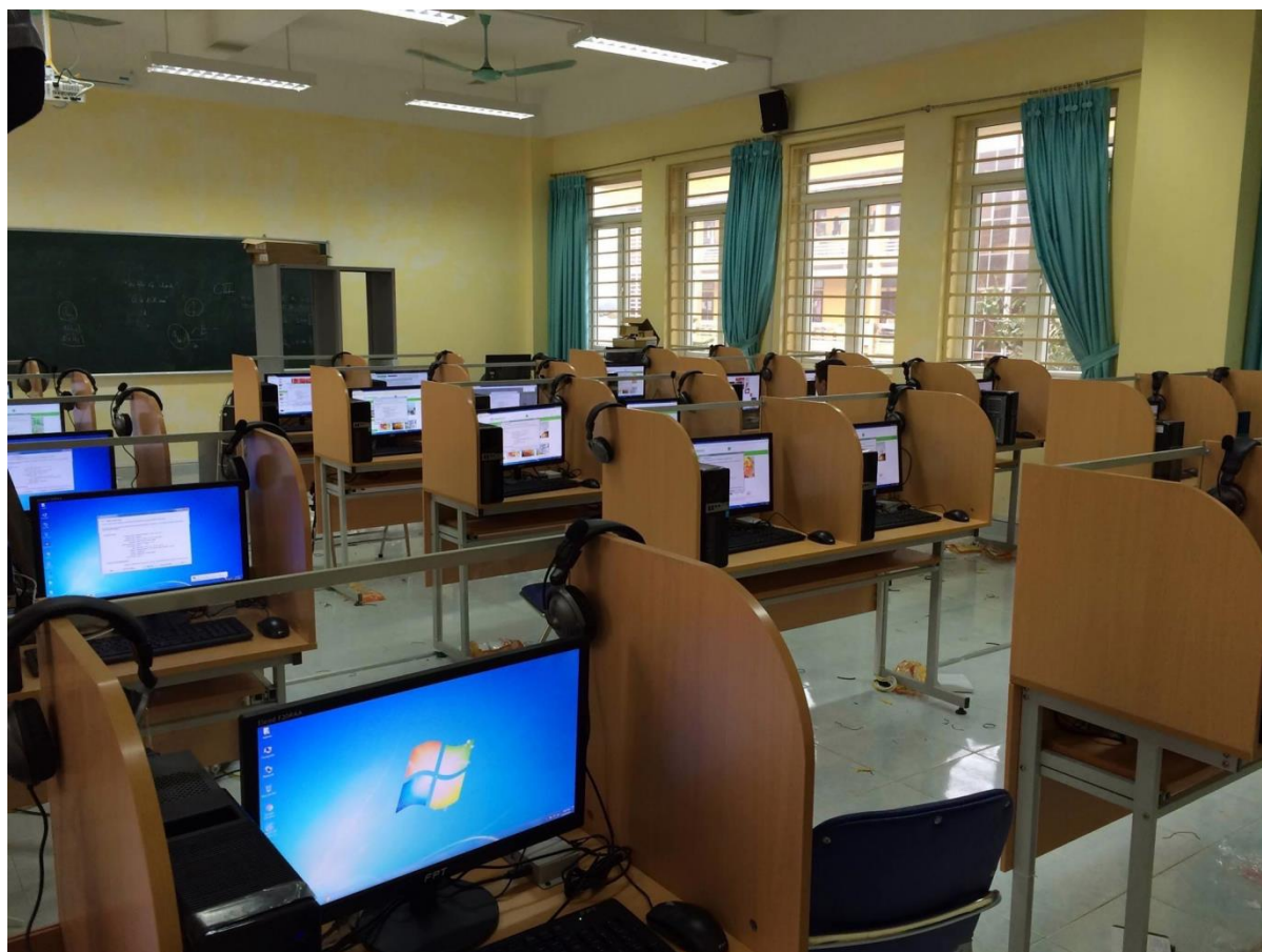
PHÒNG THI ĐÁNH GIÁ NĂNG LỰC

Thí sinh đến dự thi được các sinh viên tình nguyện đón tại cổng trường hướng dẫn đến khu vực làm thủ tục thi, tìm phòng thi nhanh chóng thuận tiện.